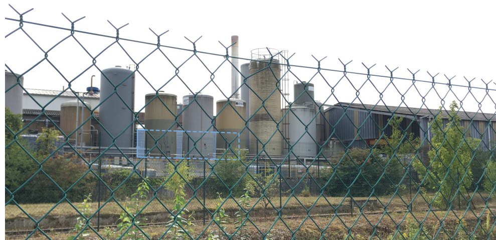
PHOTOGRAPHIE DE LA FACADE NORD DU BATIMENT A L'ETAT EXISTANT VU DEPUIS LE PARKING SITUE DERRIERE LA VOIE DE CHEMIN DE FER