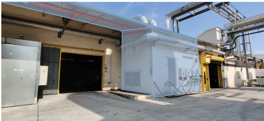
PHOTOGRAPHIE DE LA FACADE SUD DU BATIMENT A L'ETAT EXISTANT