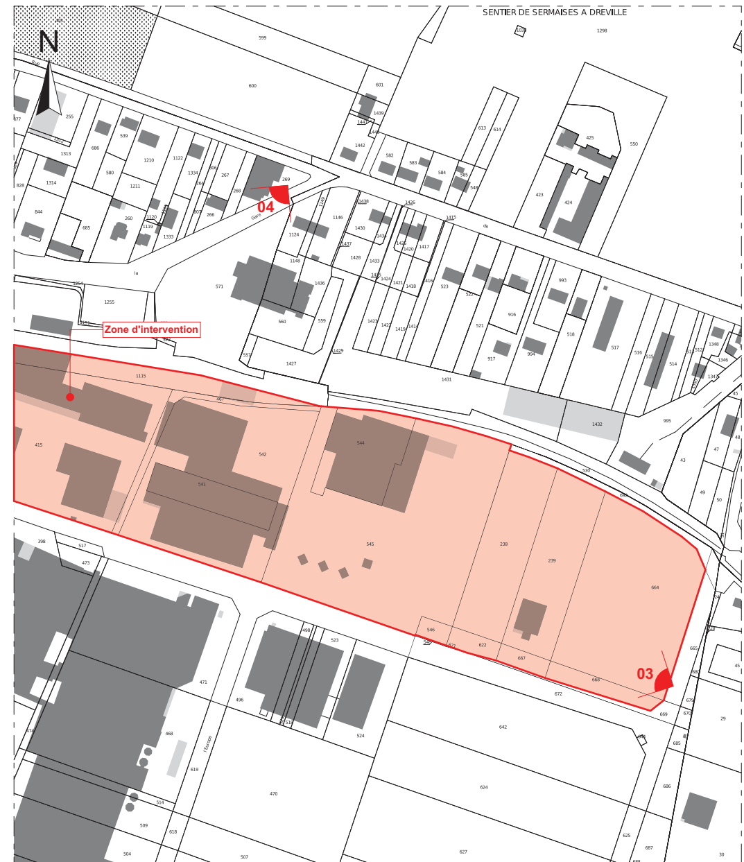
EXTRAIT CADASTRAL Ech: 1/2 500

Nota : Les plans PERMIS DE CONSTRUIRE ne sont pas des plans d'exécution. Ils ne peuvent en aucun cas être directement utilisés pour la construction.