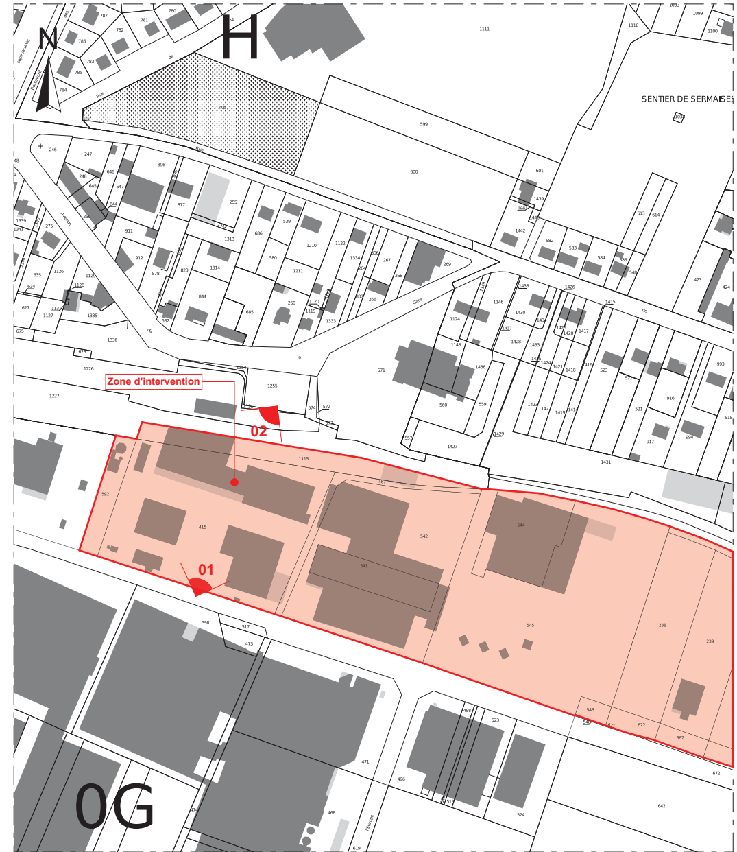
EXTRAIT CADASTRAL Ech: 1/2 500

Nota : Les plans PERMIS DE CONSTRUIRE ne sont pas des plans d'exécution. Ils ne peuvent en aucun cas être directement utilisés pour la construction.