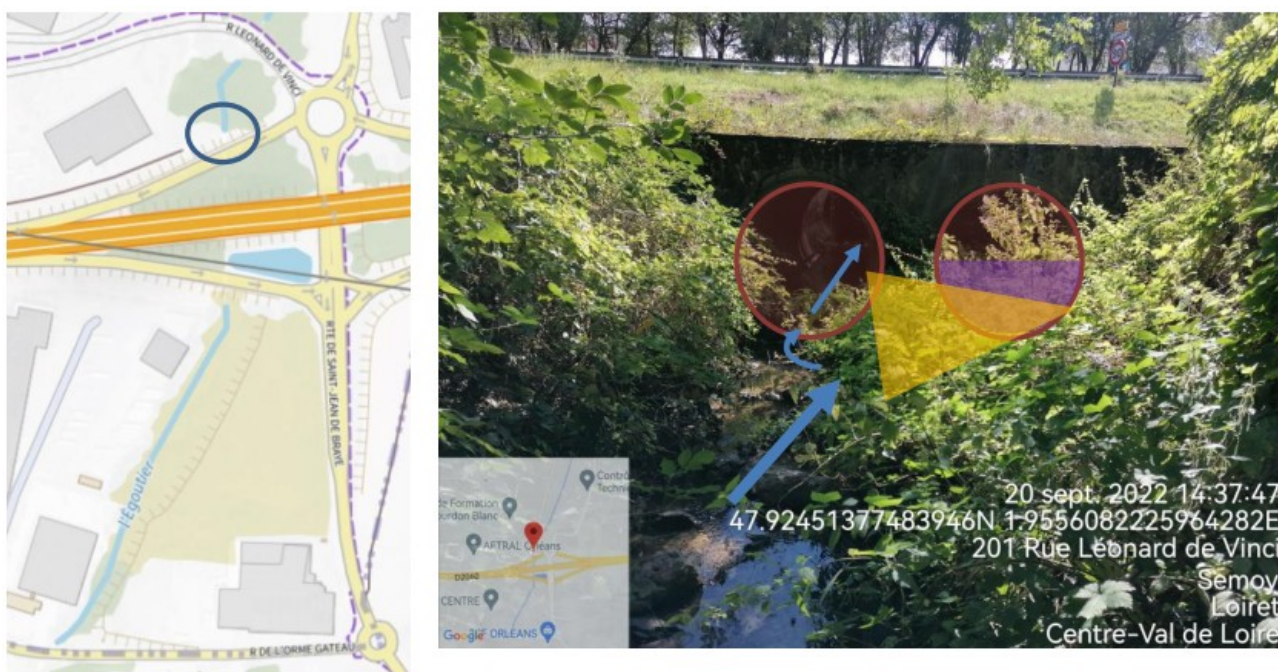
Figure 6 : Tête de buse à évaser (Flèche bleu = axe d'écoulement ; zone rouge = entrée de buse ; zone jaune = projet d'évasement ; zone voilette = niveau d'envasement dans la buse)