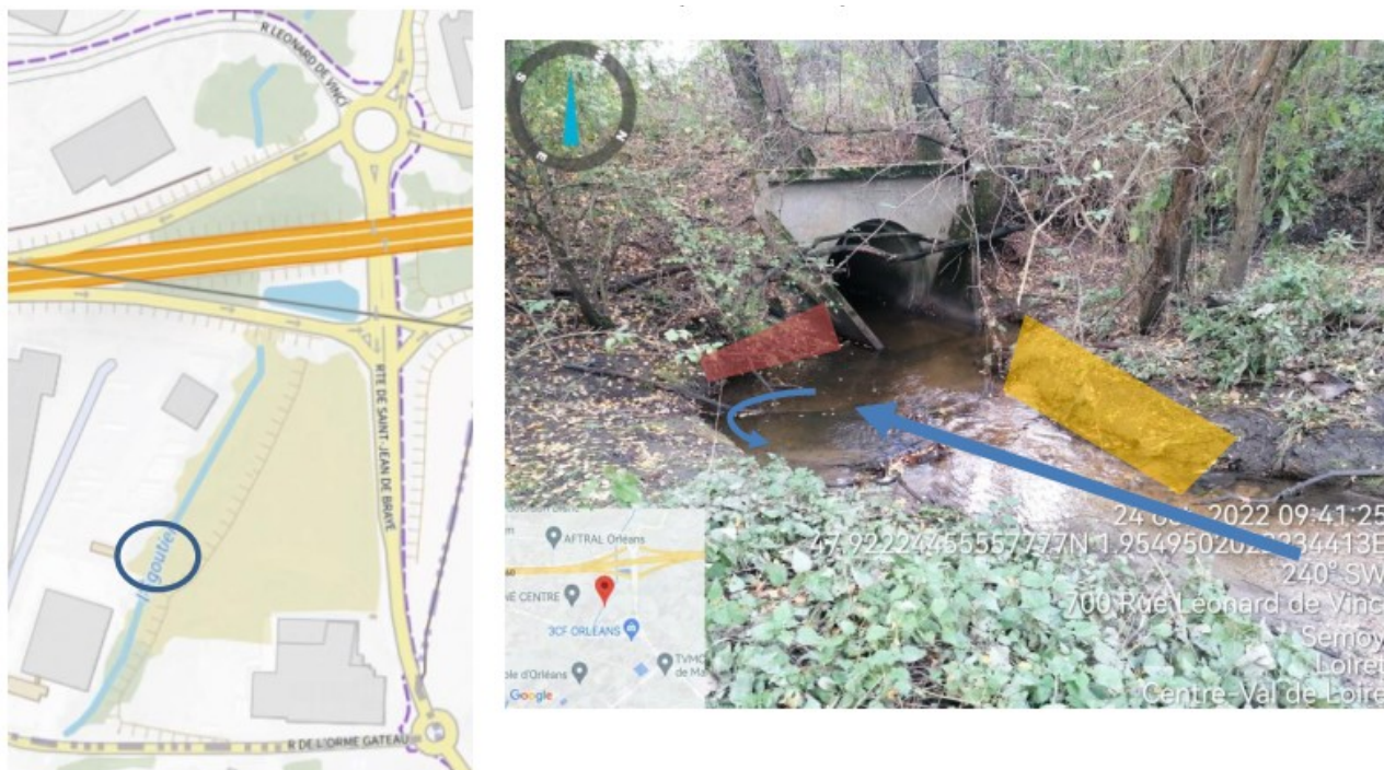
Figure 5 : Tête de buse n°1 à évaser (Flèche bleu = axe d'écoulement ; zone rouge = érosion ; zone jaune = projet d'évasement)