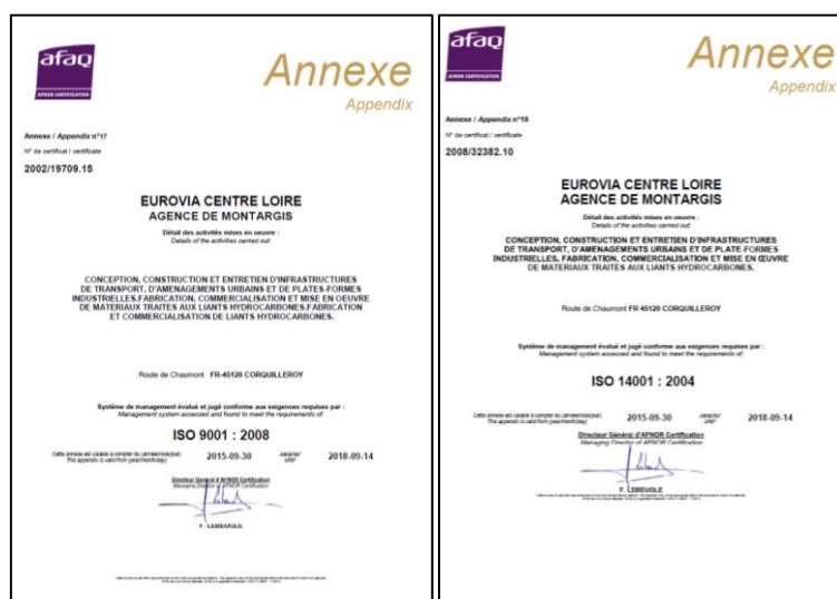
Figure 2 : Certificats ISO 9001 et ISO 14001 - 2018 Agence de MONTARGIS de EUROVIA CENTRE LOIRE

L'agence de Montargis de EUROVIA CENTRE LOIRE est en cours de renouvellement de ses certifications ISO 9001 et ISO 14001.