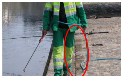
Exemples de pratiques interdites