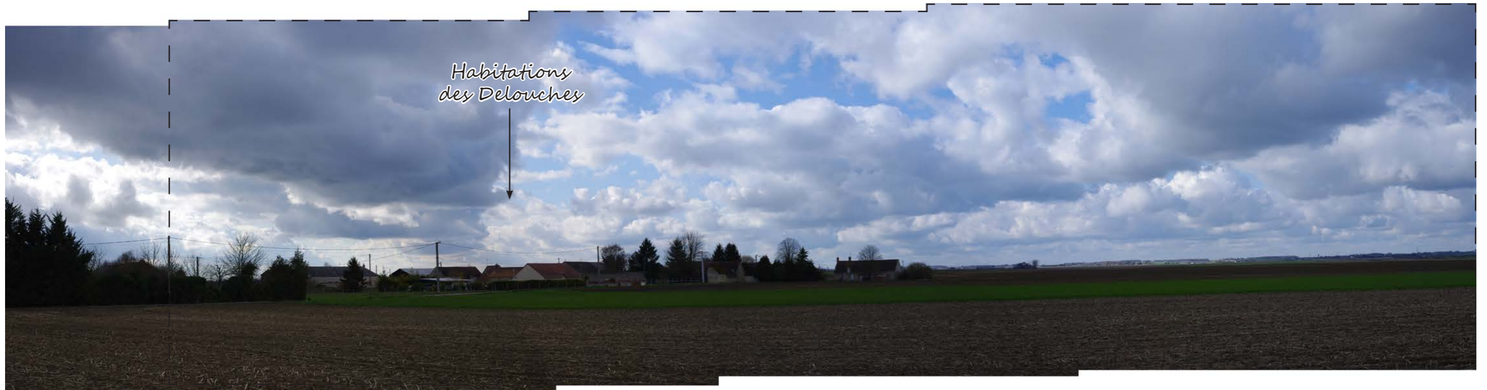
Fig.91 : Vue initiale (panorama de 4 photos - 35 mm éq. 52 mm argentiques)