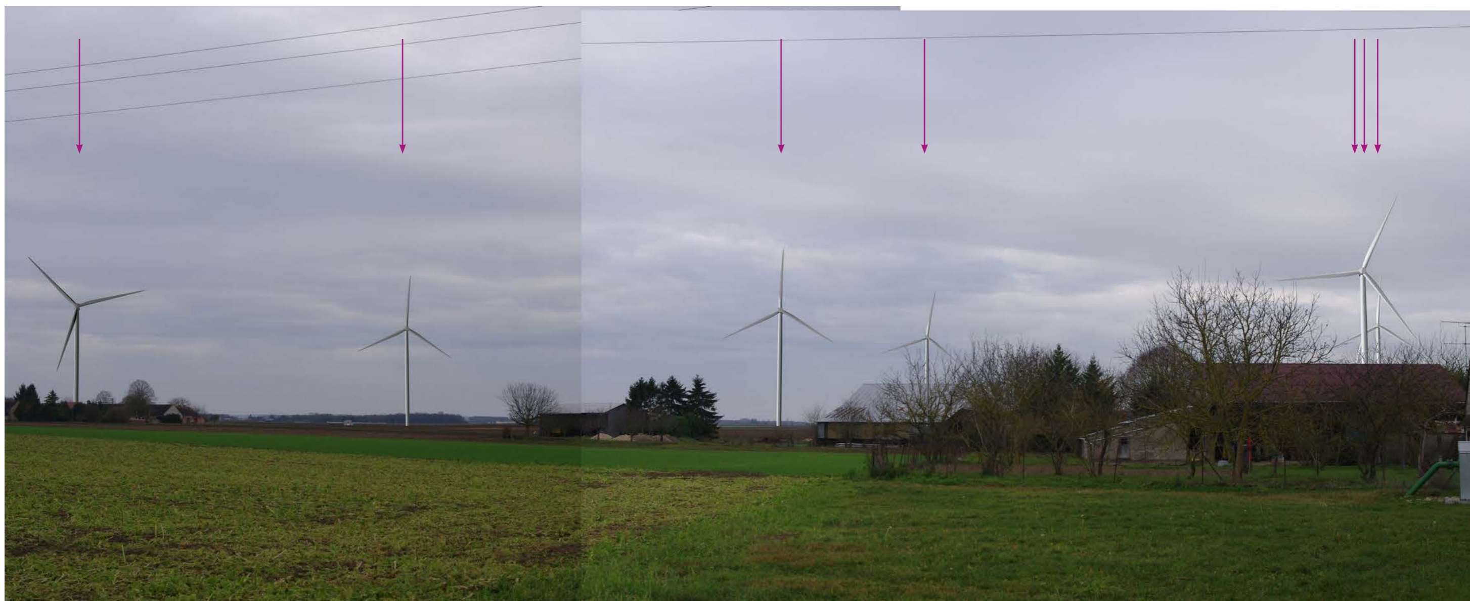
Fig.90: Photomontage (panorama de 2 photos - 35 mm équ. 52 mm argentique).

Le projet s'impose dans le paysage avec trois lignes lisibles.