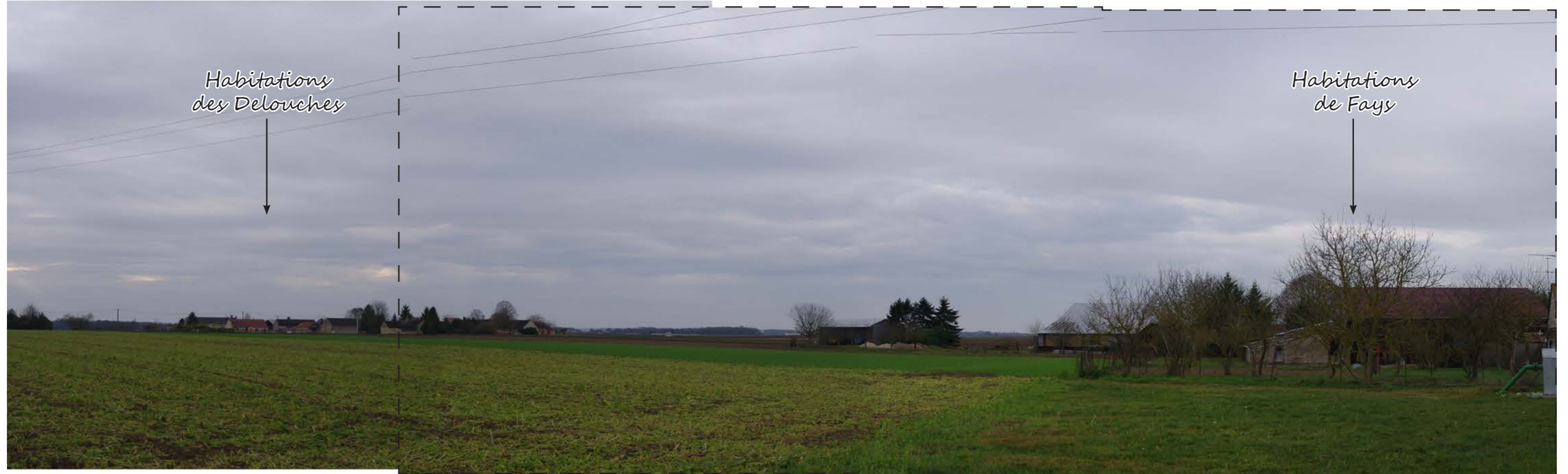
Fig. 89 : Vue initiale (panorama de 3 photos - 35 mm éq. 52 mm argentique)