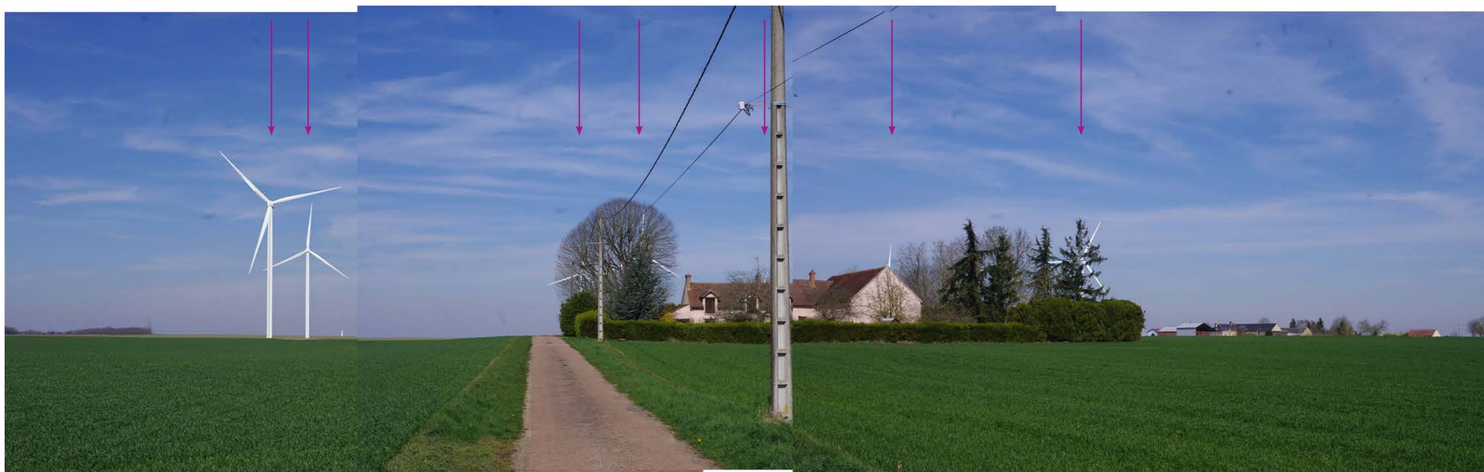
Fig.88 : Photomontage (panorama de 3 photos - 35 mm éq. 52 mm argentique).

Deux des sept éoliennes du projet sont entièrement visibles. Les autres machines sont masquées en partie par des filtres végétaux et par les habitations du Bois Bouchet. Plus hautes que les habitations, le projet induit un léger effet de surplomb.