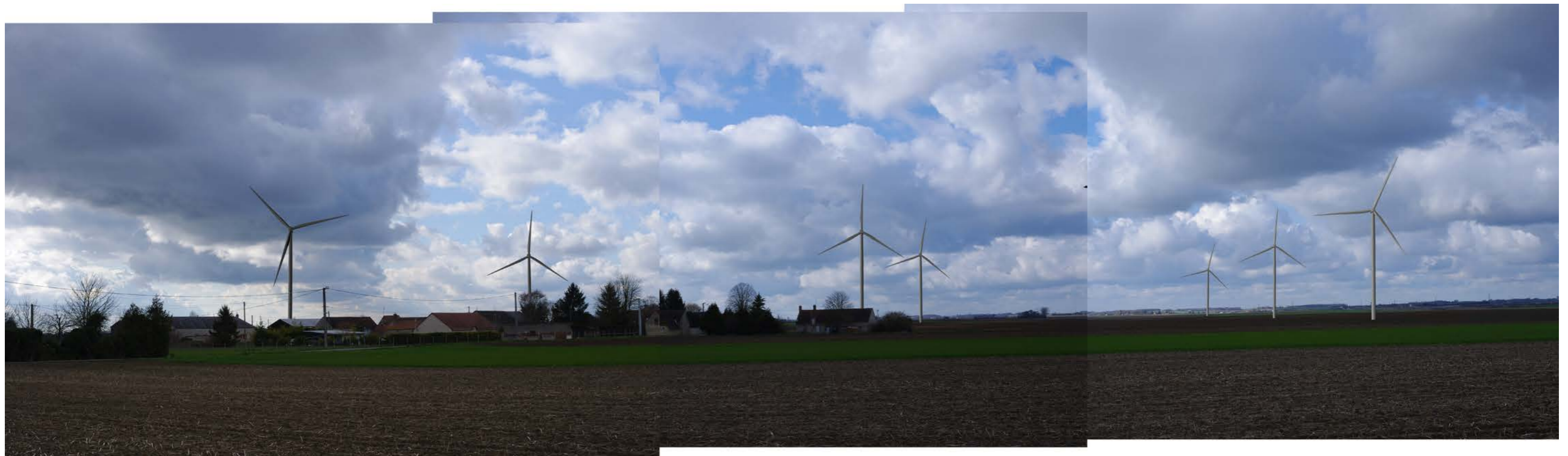
Fig.92: Photomontage (panorama de 3 photos - 35 mm éq. 52 mm argentiques).

Les 3 lignes du parc sont bien lisibles. La position des éoliennes au-dessus des habitations induit un effet de surplomb.